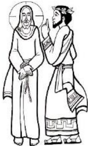
Jesús es condenado a muerte

Es fácil percibir en una familia como se va desmoronando el amor. Cuando viven como si Dios no existiera, siempre en pleitos y discusiones sin razonamiento. Manifestando caprichosamente sus impulsos.